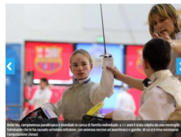
Un'adolescente somministra il vaccino anti-meningococco C a un bambino di 11 anni. È stata colpita da una meningite batterica che ha causato una paralisi estrema, un attacco sordo ai reni e il gonfiore di un braccio

Il vaccino contro il meningococco B, attualmente offerto in alcune regioni nel primo anno di età, sarà presto raccomandato per i bambini più piccoli a livello nazionale.